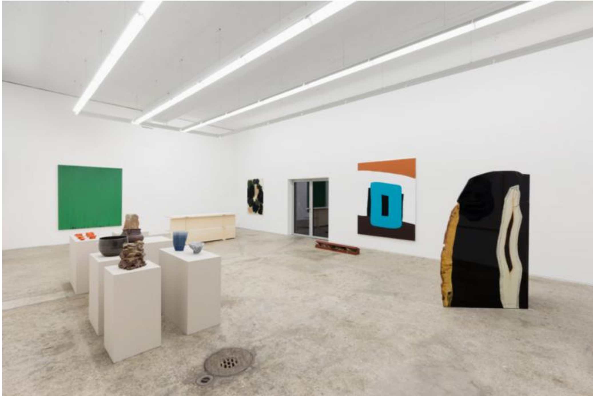
Installationsansicht der Ausstellung.

Die Ausstellung in der Galerie Mark Müller vereint Objekte und Artefakte, welche die Grenzen der Disziplinen aufbrechen. Dabei kann handwerkliches Können in einem spannungsreichen Zwiegespräch mit dem Prinzip des Zufalls stehen.